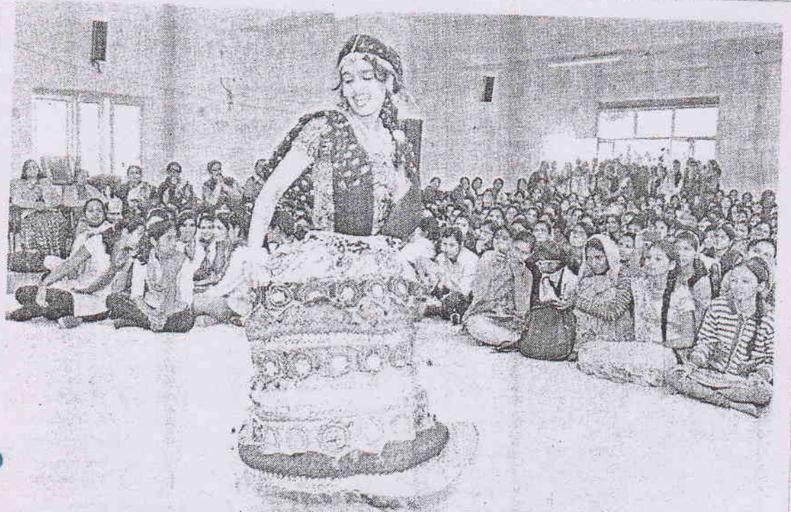
भारतपुर, आरडी गर्ल्स कॉलेज में सांस्कृतिक एवं साहित्यिक प्रतियोगिताओं के कार्यक्रम में नृत्य करती छात्रा।